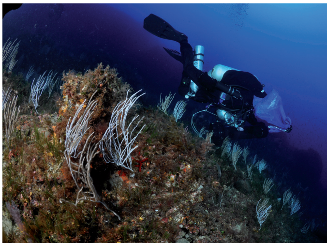
Gorgones blanches et coralligène à Pantelleria