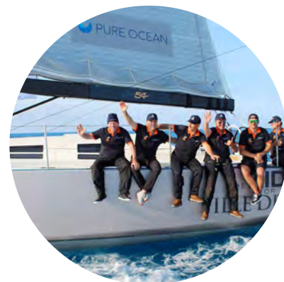
La transatlantique Bermudes Lorient - Défi Pure Ocean, mai 2022