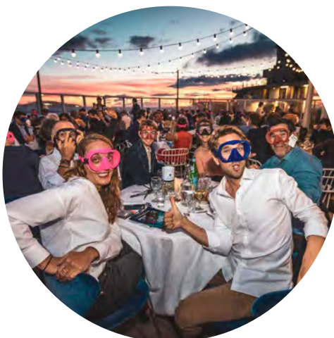
Le Gala de l'Océan, 8 juin 2022