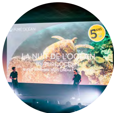
La Nuit de l'Océan, 3 ème édition - novembre 2022